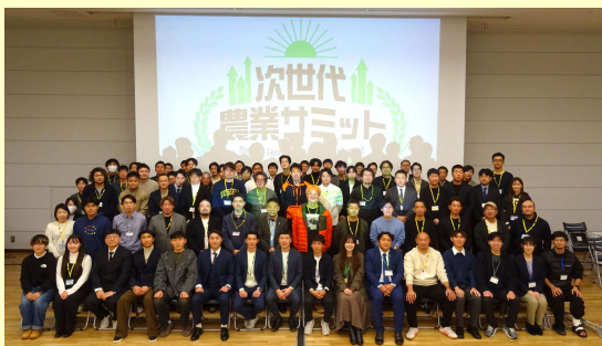
【第16回サミットの様子@東京】

同じ悩みを抱える農業経営者のネットワークを発展させ、次世代農業の創造を促すことを目的とします。